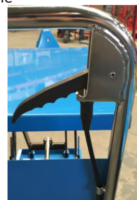
Poignée de descente