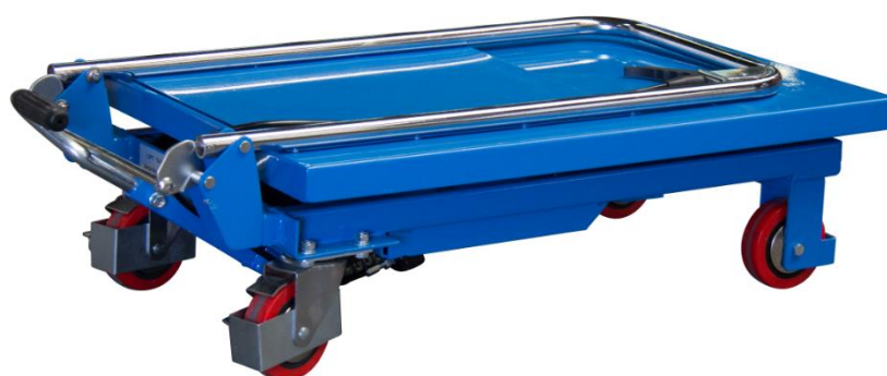
Table en position basse et arceau plié