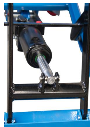
Detail tête de vérin