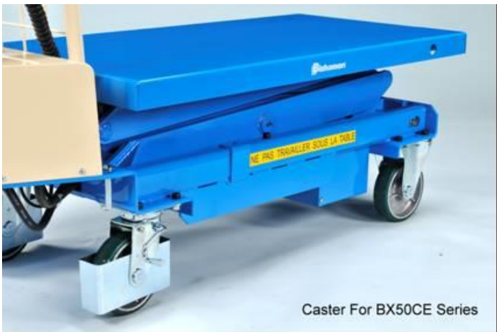
Caster For BX50CE Series