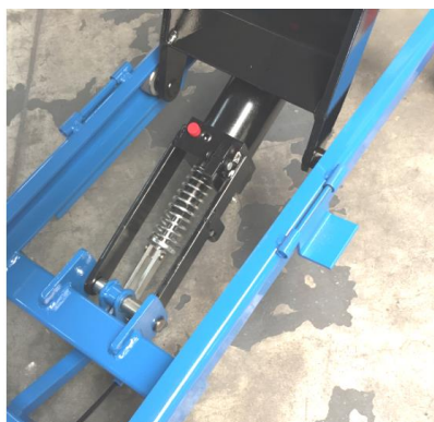
Détail pompe et système de sécurité de descente par coins