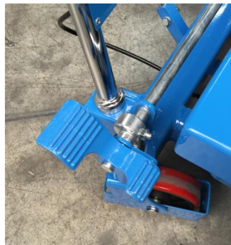
2 roues pivotantes et Freins commandés par pedale centrale au pied