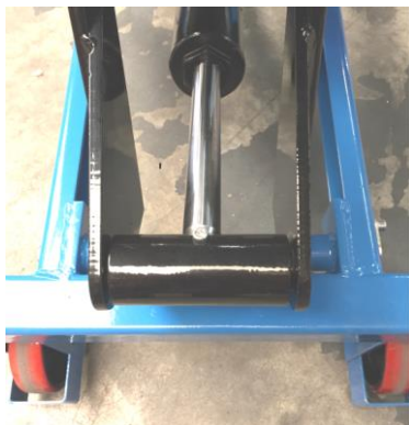
Détail tête de verin