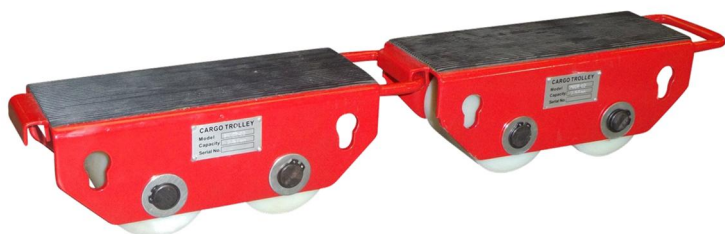
Connection en file

Rouleurs fixes en acier et caoutchouc gaufré, pouvant se connecter entre eux soit en latéral, soit en file. Galet nylon monté sur roulements à billes. Equipé de poignée de transport.