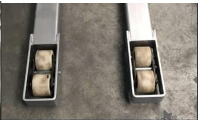
Roues avant nylon en tandem