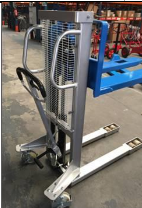
2 arceaux de poussés,