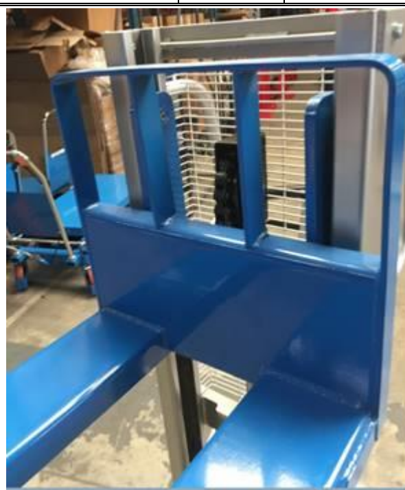
Garde corps permettant la visibilité du mouvement