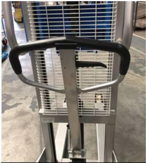
Timon recouvert de caoutchouc levier de descente, grille de protection