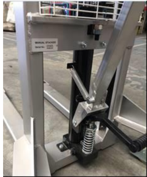
Pédale de montée par pied