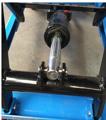
Détail tête de verin