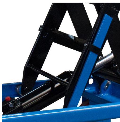
Détail de pompe, valve de sureté cable de descente