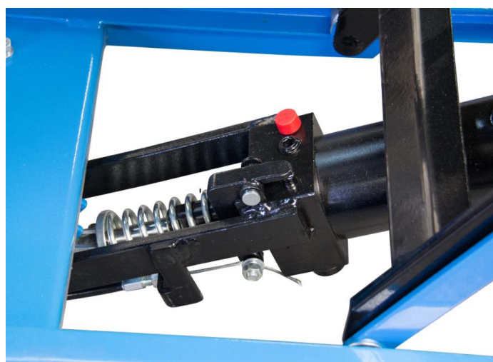
Detail pompe et système de sécurité de descente par tige